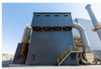
Filterinstallatie voor afvangen stof

De nieuwe fabriekshal voor de verwerking van ROZA-slak is volledig in gebruik genomen. Met de ingebruikname van de hal maken we een einde aan de kans op grafietoverlast voor de omgeving bij de verwerking van ROZA-slak. Uiteraard stoppen we niet en gaan we door met maatregelen om de overlast, door onder meer stof, zoveel als mogelijk te verminderen.